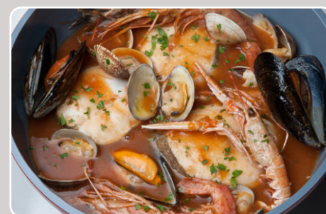
Zarzuela Zarzuela 29,90 €