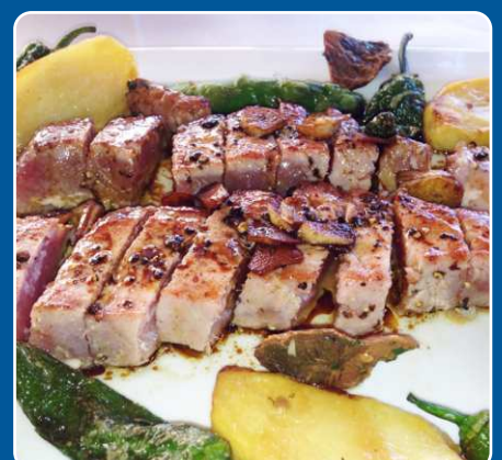
Atún Thunfisch Tuna Thon 22,00 €