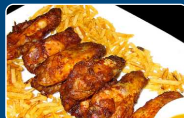
Alitas de pollo Hähnchenflügel 9,90 €