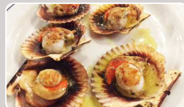
Vieiras Jakobsmuscheln 16,90 €