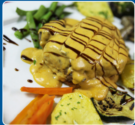
Solomillo con roquefort Filet mit Roquefort Sirloin with roquefort Filet au roquefort 28,00 €