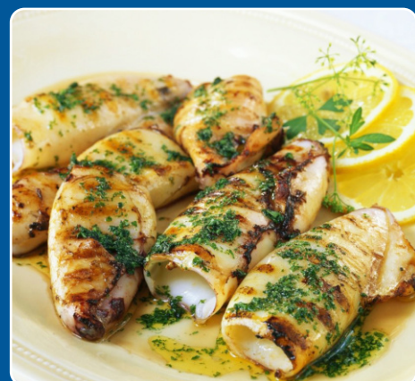
Calamares a la plancha Gegrillte Tintenfische Grilled squids Calamars grillés 17,50 €