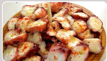
Pulpo a la gallega Tintenfisch a la Gallega 23,00 €