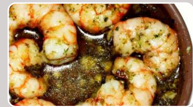
Gambas Ajillo Garnelen in Knoblauch 16,90 €