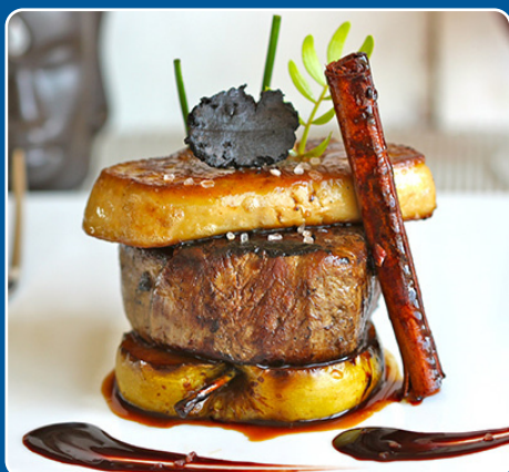
Solomillo Foie gras Filet Foie gras Sirloin Foie gras Filet Foie gras 32,00 €