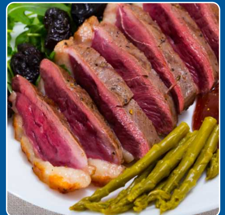
Magret de pato Entenbrust Duck breast Magret de canard 20,00 €