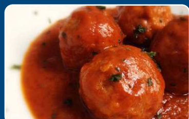
Albondigas Fleischbällchen 9,50 €