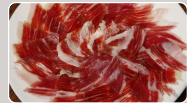
Jamón Ibérico Ibérico Schinken 19,00 €