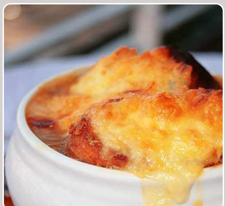
Sopa de cebolla Zwiebelsuppe Onion soup Soupe aux oignons 9,90 €