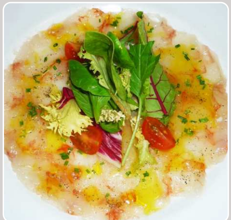
Carpaccio de gambas Garnelen Carpaccio Prawn carpaccio Carpaccio de crevettes 22,00 €