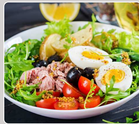
Ensalada mixta Gemischter Salat Mixed salad Salade mixte 8,90 €