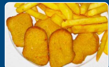
Nuggets de pollo Hähnchen Nuggets 9,90 €