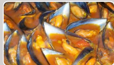
Mejillones Miesmuscheln 13,90 €