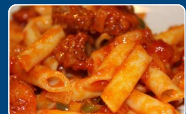
Macarrones Makkaroni 9,90 €