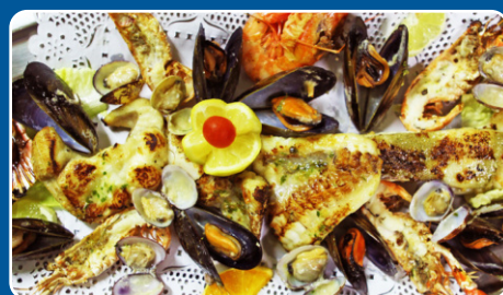
Parillada de pescado Gegrillter Fisch Grilled fish Poissons grillés 29,90 €