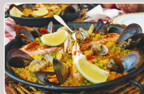
Paella mixta Paella mixte 22,00 €