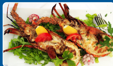
Bogavante a la plancha Gegrillter Hummer Grilled lobster Homard grillée 35,00 €