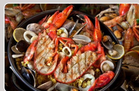
Paella con bogavante Paella avec homard 35,00 €