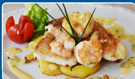
Merluza con gambas Seehecht mit Garnelen Hake with prawns Merlu aux crevettes 19,50 €