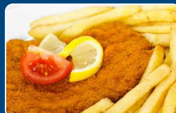
Escalopa con patatas Schnitzel mit Pommes 10,90 €