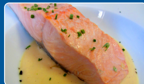
Salmón al Cava Lachs an Cava Salmon with Cava Saumon avec Cava 18,90 €