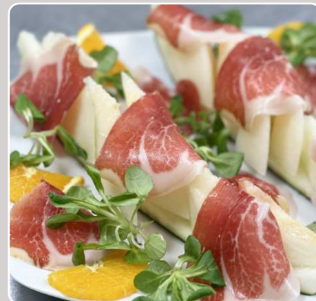
Melón con jamón Melone mit Schinken Melon with ham Melon au jambon 13,90 €