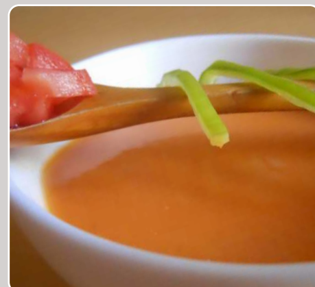
Gazpacho Kalte Gemüsesuppe Gazpacho Gazpacho 8,50 €