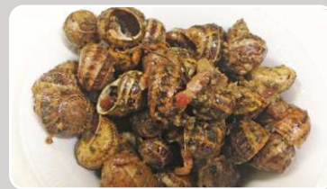
Caracoles Schnecken 15,90 €