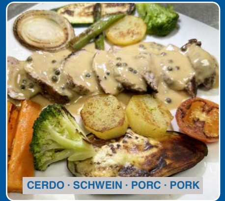
Solomillo a la pimienta Schweinefilet mit Pfeffersauce Sirloin with pepper sauce Filet au poivre 18,90 €