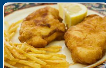
Merluza rebozada Panierter Seehecht 13,50 €