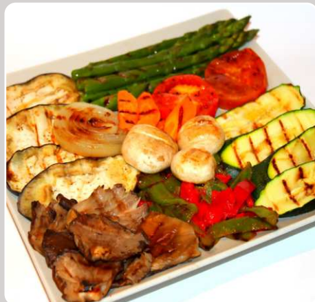
Parrillada de verduras Grillgemüse Grilled vegetables Légumes grillés 14,90 €