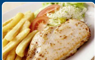
Pollo con patatas Hühnchen mit Pommes 10,90 €