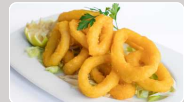
Calamares a la romana Tintenfischringe 16,50 €