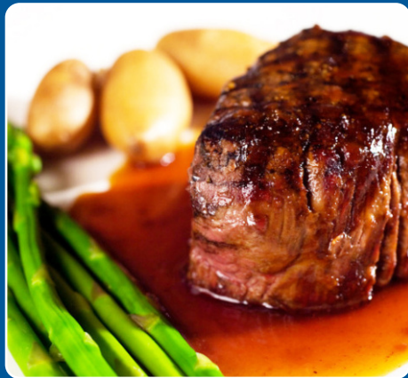
Solomillo Filet Sirloin Filet mignon 28,00 €