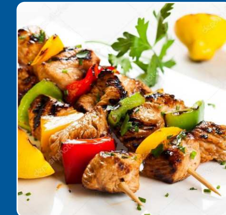
Brochetas mexicanas Fleischspiesse Meat splits Broches de viande 17,50 €