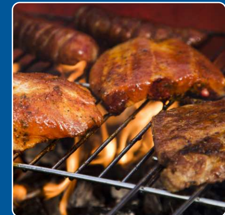
Parrillada de carne Gemischte Fleischplatte Mixed grilled meat Viande grillée 18,50 €