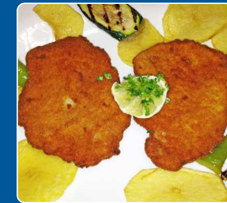
Escalope Milanesa Paniertes Schnitzel Breaded escalope Escalope panée 13,90 €