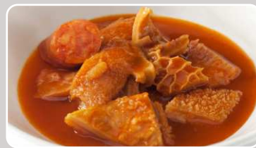
Callos Kutteln 13,90 €