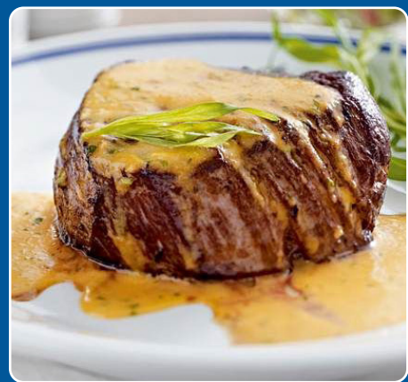
Entrecot con roquefort Entrecôte mit Roquefort Entrecôte with roquefort Entrecôte au roquefort 23,90 €