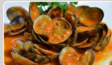
Almejas a la marinera Venusmuscheln 15,90 €