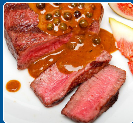
Entrecot a la pimienta Entrecôte mit Pfeffersauce Entrecôte with pepper sauce Entrecôte au poivre 23,90 €