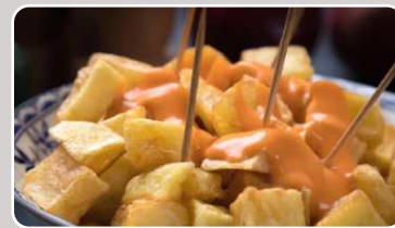
Patatas Bravas Würzige Kartoffelstücke 6,50 €