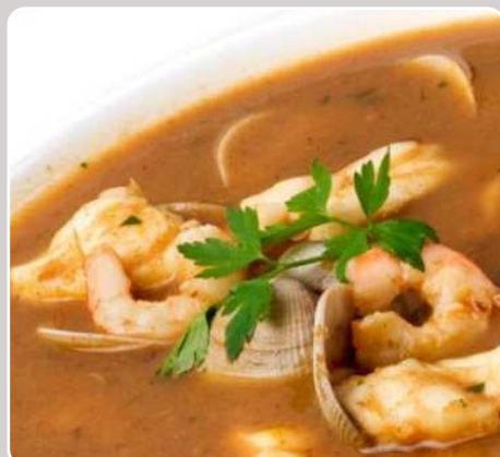
Sopa de pescado Fischsuppe Fish soup Soupe de poisson 12,50 €