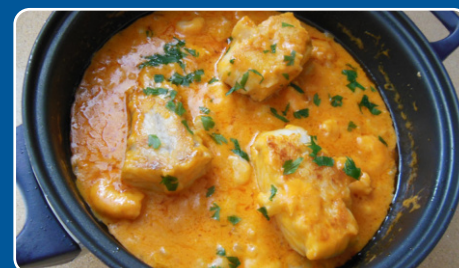
Rape al cabrales Seeteufel mit Ziegenkäse Monkfish with goat cheese Lotte au fromage 24,90 €