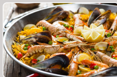
Paella marisco Paella fruits de mer 23,00 €