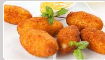
Croquetas caseras Kroketten 8,50 €