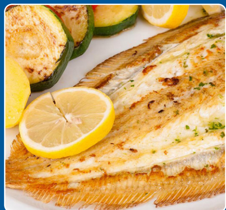
Lenguado a la plancha Seezunge vom Grill Grilled sole Sole grillée 24,90 €