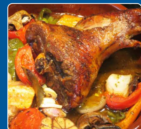
Espalda de cordero Lammrücken Saddle of lamb Selle d'agneau 23,00 €