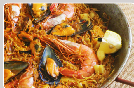
Fideuá Fideuá 19,90 €