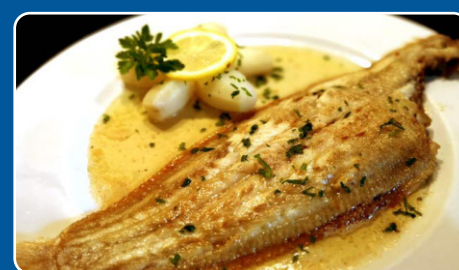
Lenguado a la Meunière Seezunge à la Meunière Sole meunière Sole Meunière 29,00 €