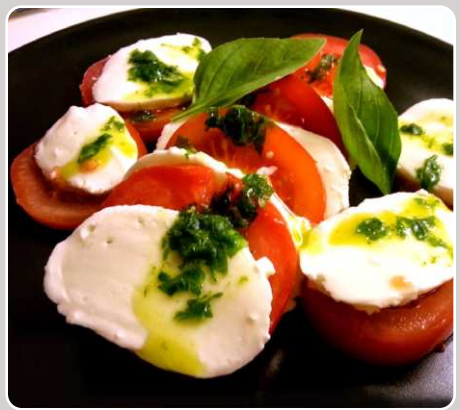
Ensalada caprese Tomaten-Mozzarella Salat Caprese salad Salade caprese 10,90 €