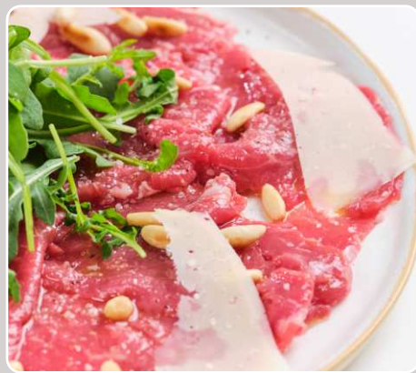
Carpaccio de ternera Carpaccio vom Rind Beef carpaccio Carpaccio de bœuf 22,00 €