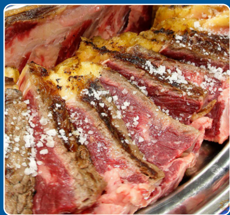
Entrecot Entrecote Entrecote Entrecôte 22,00 €