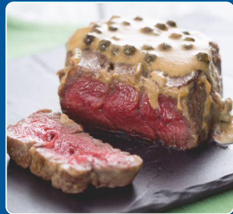
Solomillo a la pimienta Filet mit Pfeffersauce Sirloin with pepper sauce Filet au poivre 28,00 €