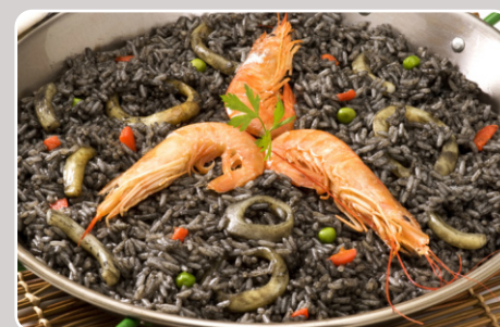
Arroz negro Riz noir 23,00 €