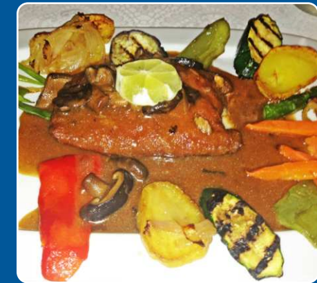
Cordon Bleu Cordon Bleu Cordon Bleu Cordon Bleu 17,90 €