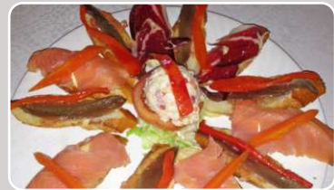
Surtidos de tostadas Canapés 15,90 €